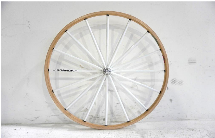
ブナリム16コンプレッションスポークホイール