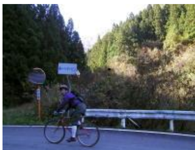
コース途中から①～⑦までのヘアピンが現れる(右図参照) 上記写真は第一ヘアピン