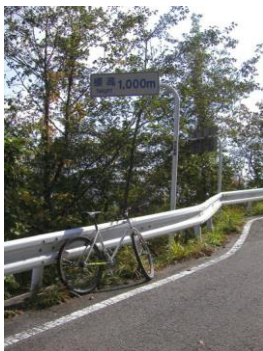
標高 800m から 200m ごとに 1400m まで標高を示す標識がある。