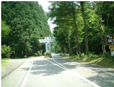
↑ チェリーパークライン看板